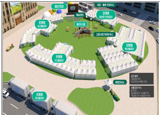
<23년 품목별 부스배치 조감도>