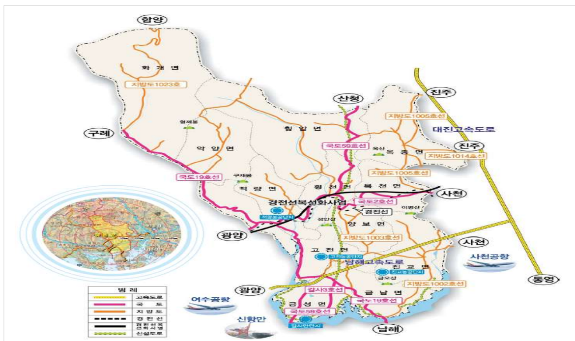
〈그림 2〉 하동군 지리적 위치