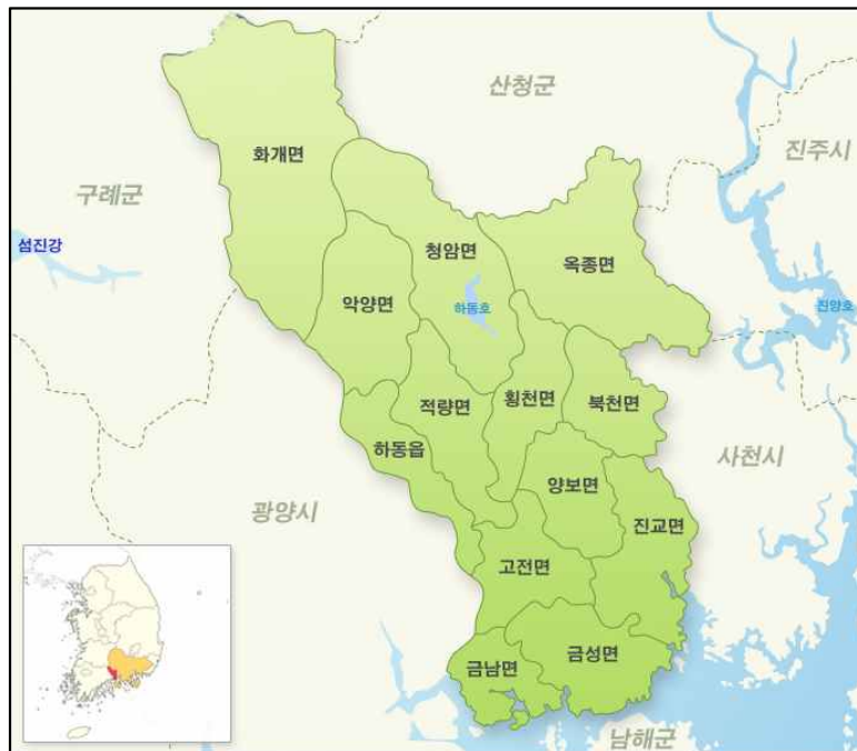
<그림 1> 하동군 읍면별 지도