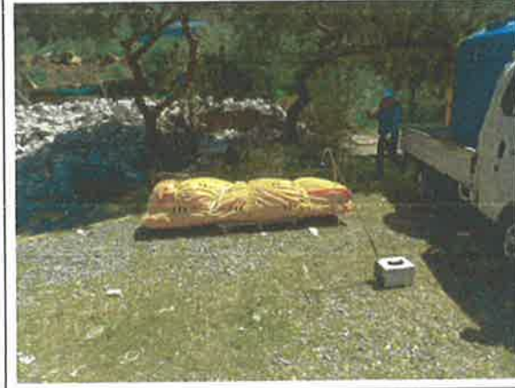
#6 폐기물 보관지점