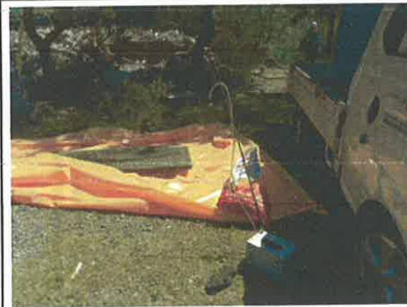
#5 폐기물 반출구