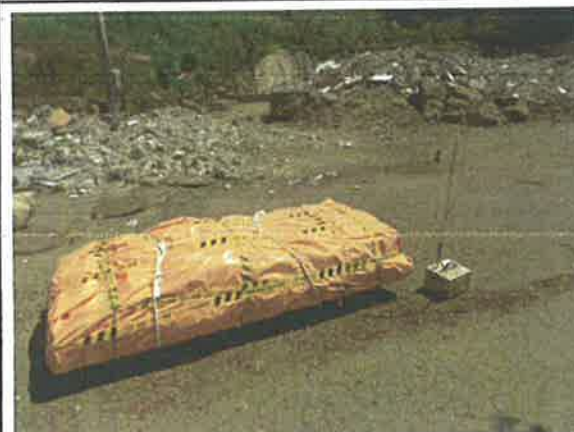
#5 폐기물 보관지점