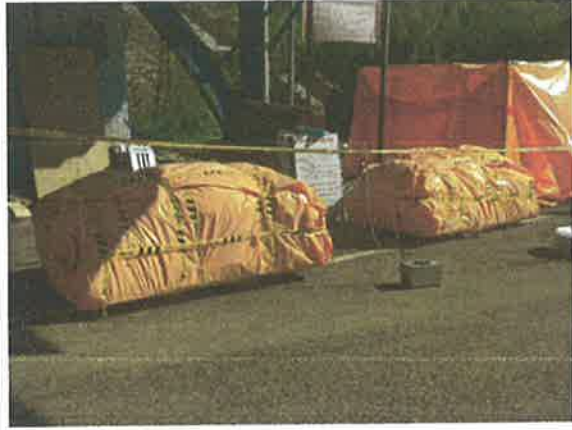
#8 폐기물 보관지점