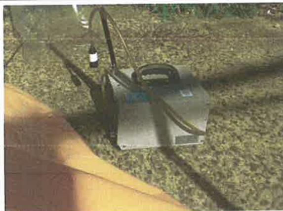
#9 음압기 배출구2