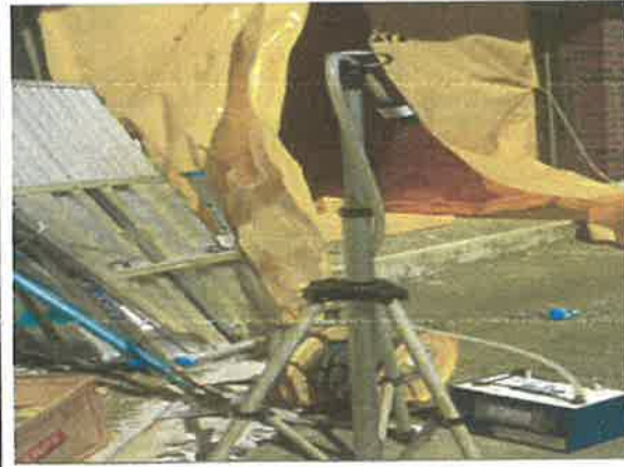
#10 폐기물 반출구2