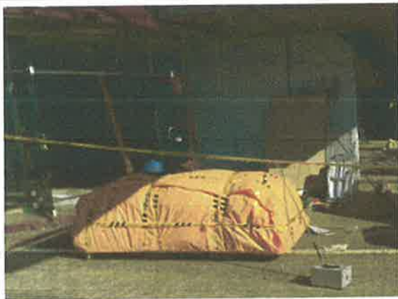
#7 폐기물 반출구1