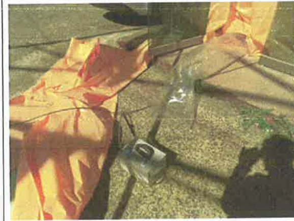
#6 음압기 배출구1