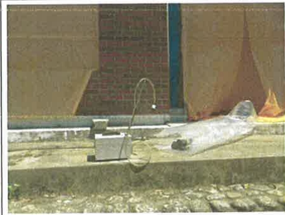
#6 음압기 배출구