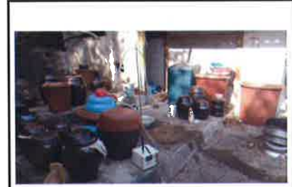
작업장 주변 실외