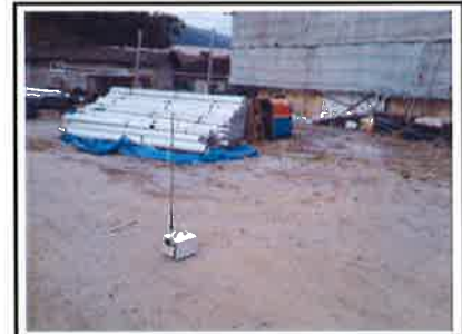
작업장 주변 실외